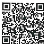
แบบสำรวจฯ