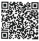
หนังสือกรมบัญชีกลาง